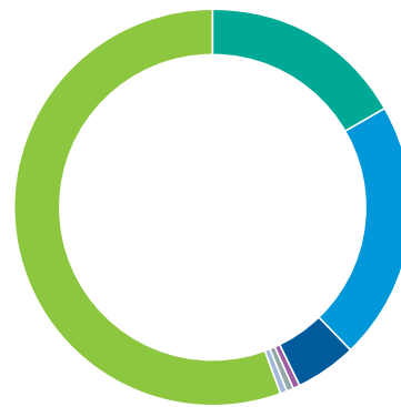
СТРУКТУРА ЗАКУПОК КОМПАНИИ ПО ВИДАМ ДЕЯТЕЛЬНОСТИ (МЛН РУБ.)